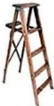
tikapuut / tikkaat